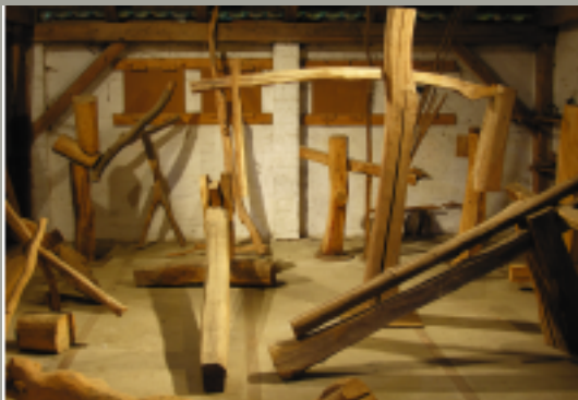
Atelier in Mehrum

Nach einer längeren Schaffensperiode mit politischen und religiösen Themen folgte eine Phase der Loslösung vom Gegenständlichen hin zu einer freien Abstraktion und der Suche nach Schönheit im kleineren Format. Dabei brachten vermutlich die freiwillige Abgeschiedenheit auf seinem Bauernhof in Mehrum, sowie die Konzentration auf gestalterische Form- und Lebensfragen, entscheidende Impulse für seine kreative Arbeit.