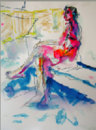
"Commercial Nude", 2007 - 30 x 20 cm