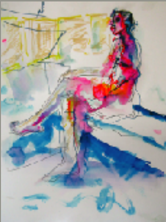
"Commercial Nude", 2007 - 30 x 20 cm